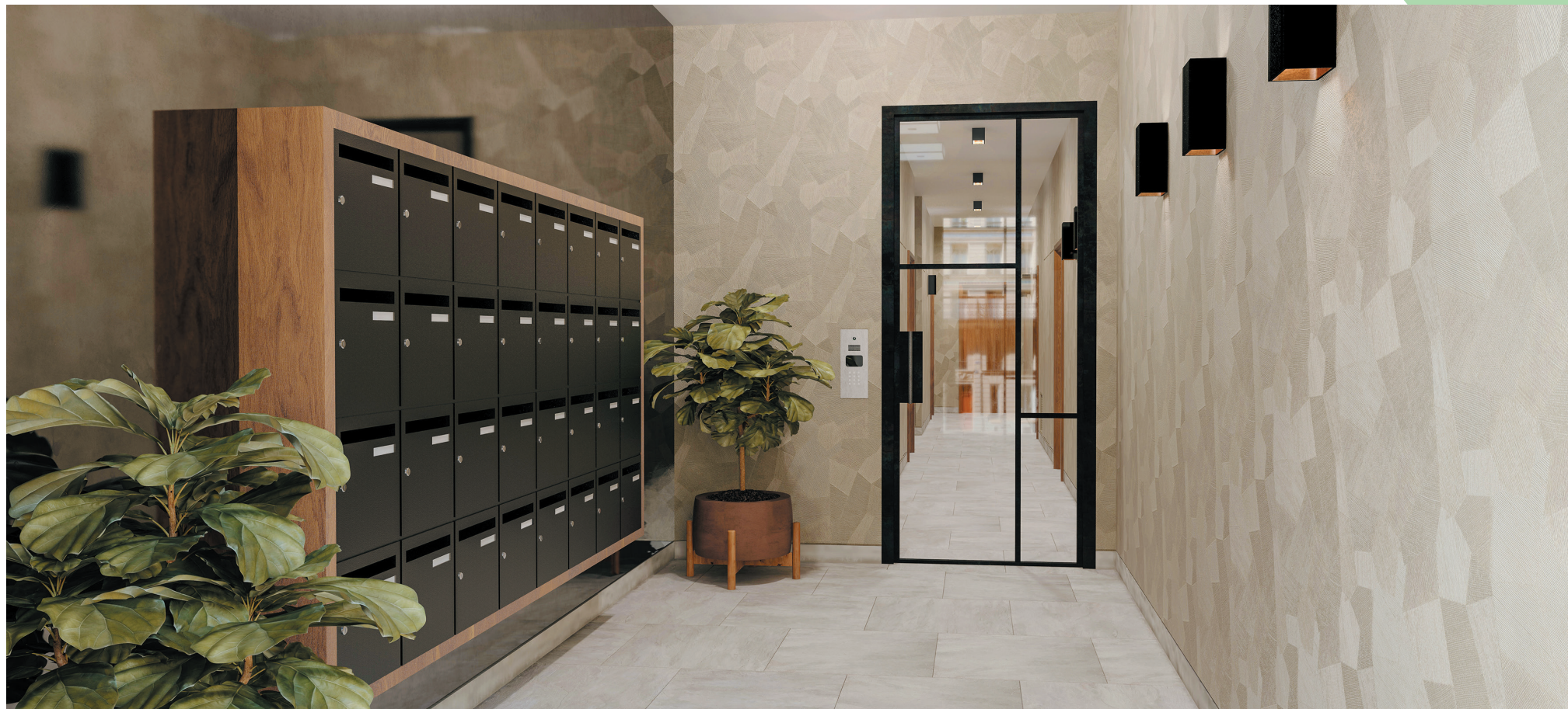
Exemple de hall réalisé par PREFERENCE HOME

Enfin, soucieuse de ses responsabilités environnementales, la résidence met un point d'honneur à offrir un excellent niveau de performances écoresponsables.